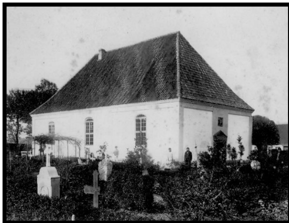
Den reformerte kirke, ca. 1920.

De reformerte var en anden form for kristne end katolikker og protestanter. Mange af dem boede i Frankrig. Her blev de forfulgt, og de var derfor flygtet til Tyskland. De var dygtige til at handle og dyrke tobak. Derfor inviterede kongen dem til Fredericia, så de kunne hjælpe byen med at vokse.