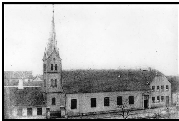
Sankt Knuds Kirke, ca. 1880.

Katolikkerne byggede Sankt Knuds kirke og skole i Sjællandsgade. De findes i dag, men kirkegården er væk.