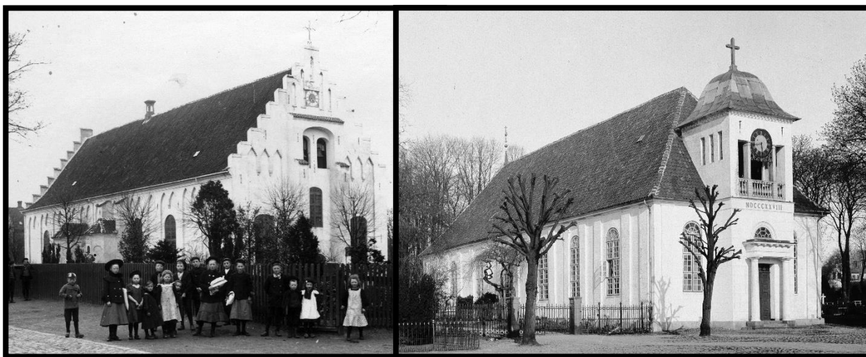
Til venstre: Trinitatis Kirke, ca. 1900.

Michaelis blev mest brugt af byens soldater, og Trinitatis mest af byens borgere. Begge kirker og deres kirkegårde findes stadig i dag. Siden er der bygget flere kirker uden for Fredericias volde.