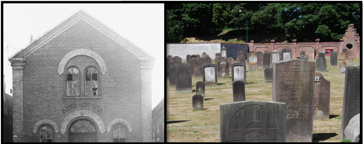
Til venstre: Den jødiske synagoge kort før den blev revet ned i 1914.

Jøderne byggede en synagoge (et bedehus) i Riddergade, og lagde en gravplads ved Vester Voldgade. Synagogen er væk i dag, men gravpladsen kan man stadig besøge.