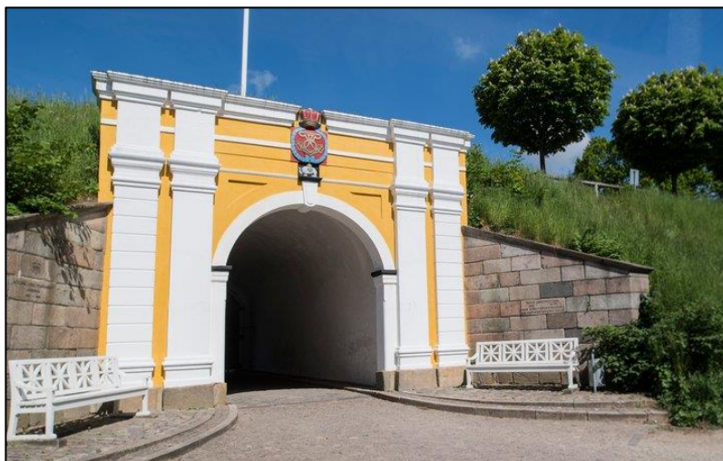
Prinsens Port og volden viser, at Fredericia engang har været en fæstning.