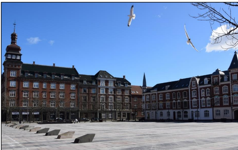
Geddesborg og Axelhus på Axeltorv. Jesper Jespersen har tegnet Axelhus (Foto: Sarah H. Hoyer).

En af de stilarter, man kan se på mange huse og bygningsværker i Fredericia, er historicisme . Det betyder, at bygningerne minder om slotte, borge eller templer fra fortiden. Mange af disse store huse er bygget mellem 1850 og 1930. De har navne som Ridderborg eller Geddesborg og har høje tårne som på slotte.