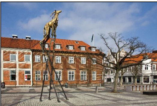
Guldkalven på Rådhuspladsen.

Nogle værker kan godt være en blanding af abstrakt og naturalistisk – fx Guldkalven på Rådhuspladsen i Fredericia.