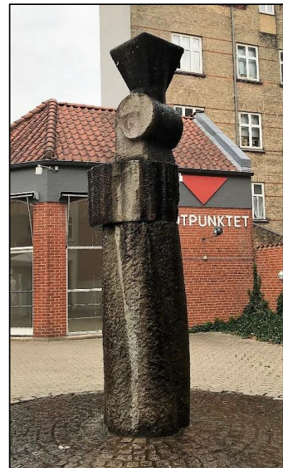
Søjlen i Midtpunktet er et abstrakt kunstværk.