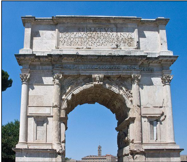
Romersk triumfbue med søjler. Ca. 2000 år gammel.

Når man ser på, hvordan bygninger er formet og lavet, kalder man det for bygningskunst eller arkitektur . På samme måde som man har haft forskellig tøjmode gennem historien, har man også haft forskellige stilarter inden for husbyggeri. En bygning udseende og arkitektur kan derfor fortælle meget om, hvornår den er lavet.