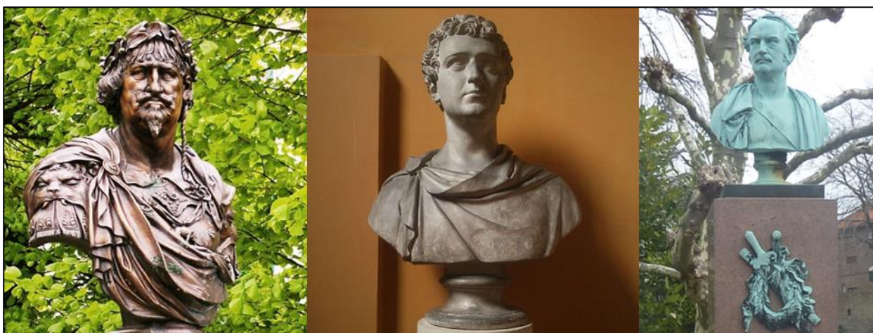
Nyklassiske buster: Christian den 4. (Lavet for 300 år siden), Frederik den 8. og general Olaf Rye (Begge lavet for ca. 150 år siden) (Fotos: Wikiusers Florian-Zet, OBTMJ og Leif Jørgensen (Alle: CC BY 3.0)).