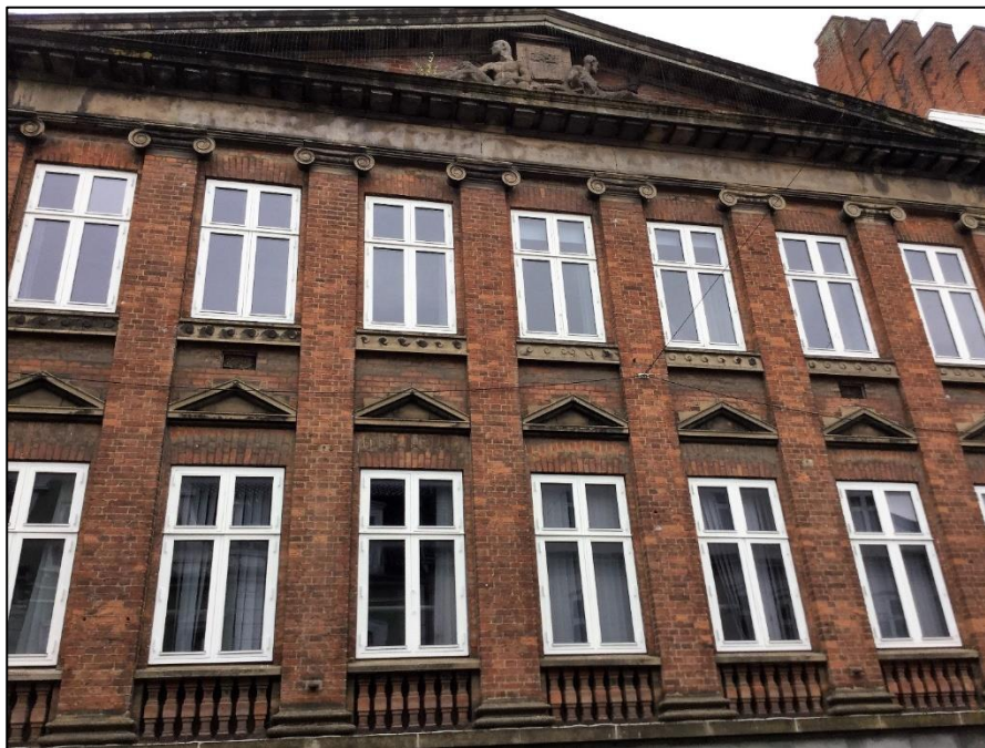
Danmarksgade 9 med søjler, trekantede og relief (Arkitekt: Jesper Jespersen).

Nyklassiske huse kan have høje slanke søjler, men også trekantede, hvor der er relieffer, der forestiller mennesker. Endelig er der også nogle steder store buer, der kan være symbol på sejr og magt.