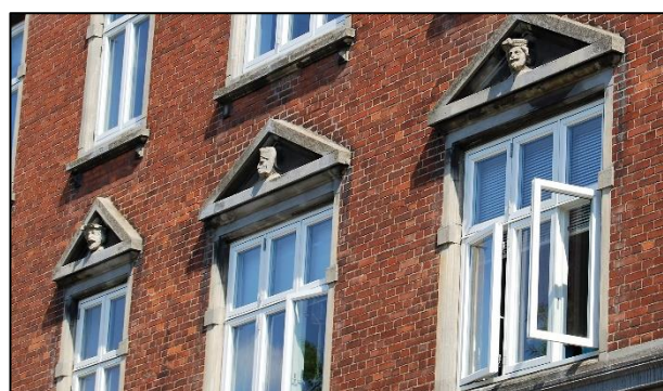
Detaljer fra Geddesborg.