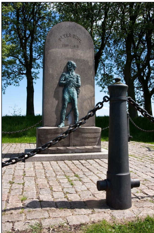
Peters Buhls mindesmærke på Øster Voldgade.