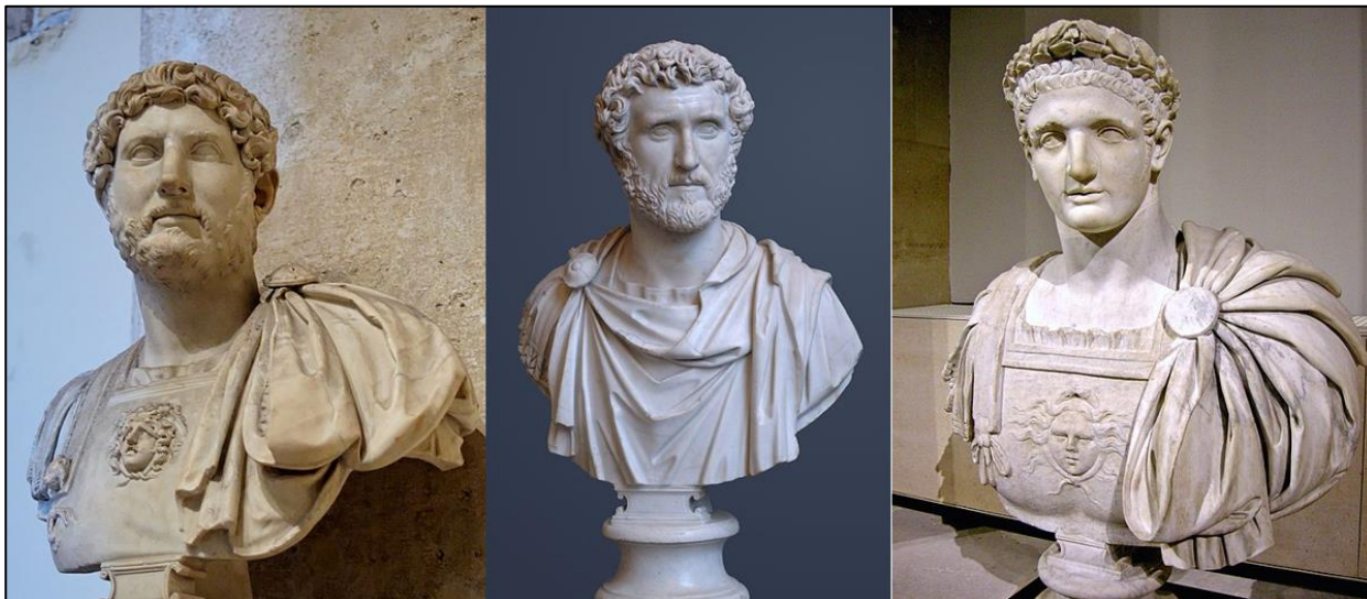
Buster af romerske kejsere. Ca. 2000 år gamle.

Mange mindesmærker er også nyklassiske, hvor man har lavet en buste af fx en konge, som man gjorde i det gamle Grækenland og Rom. Ofte har kongen romersk tøj på, og der er sværd eller krans på som symboler på sejr og magt.