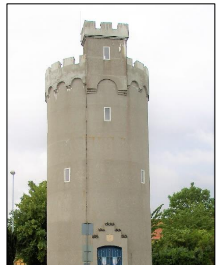
Bogense Vandtårn er tegnet af arkitekt Gundlach-Pedersen i 1910. Det ligner et nærmest et fæstningstårn fra Middelalderen.