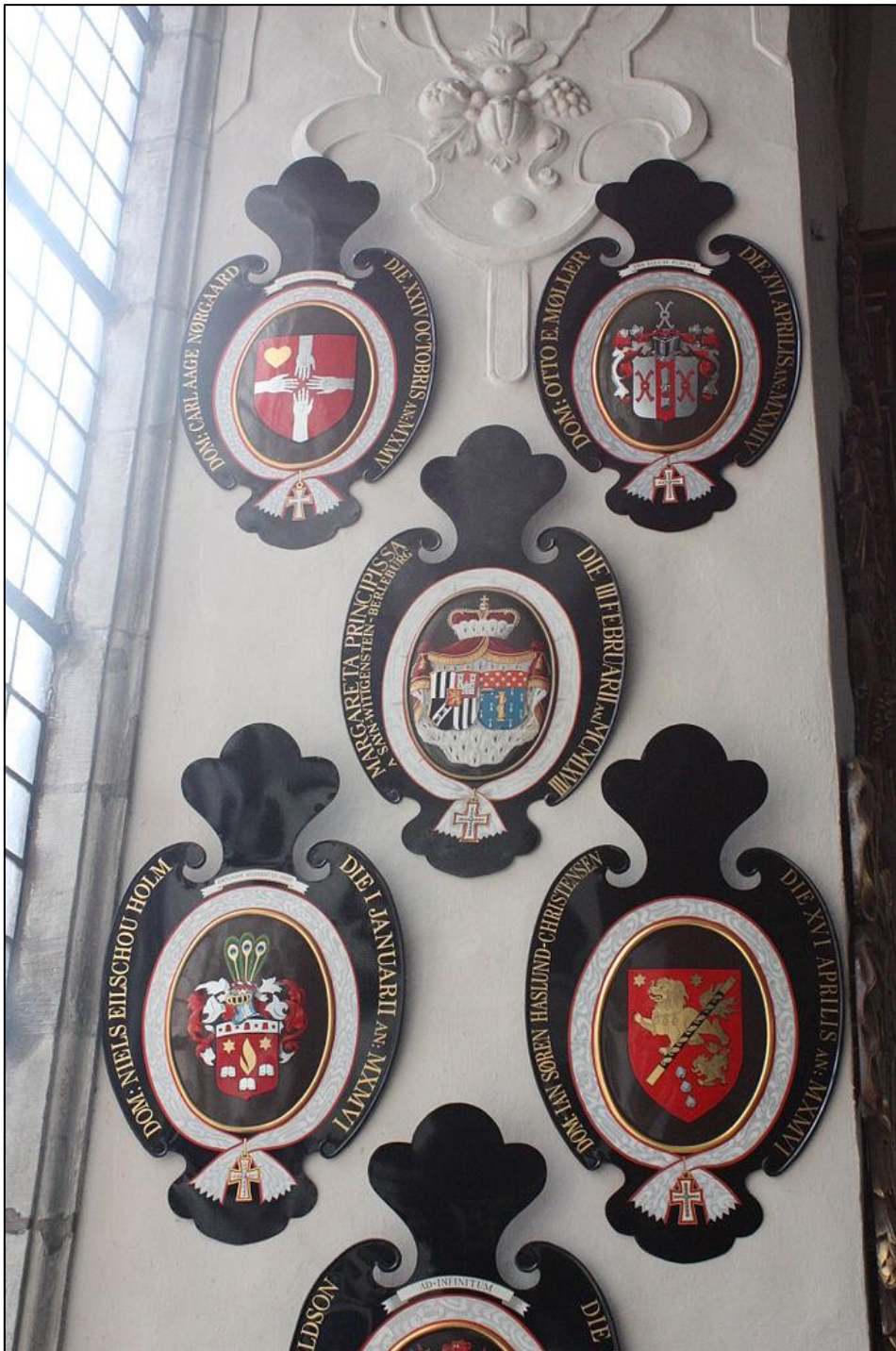
(Billede af våbenskjold - Wikiuuser: Politikaner CC BY-SA 4.0)