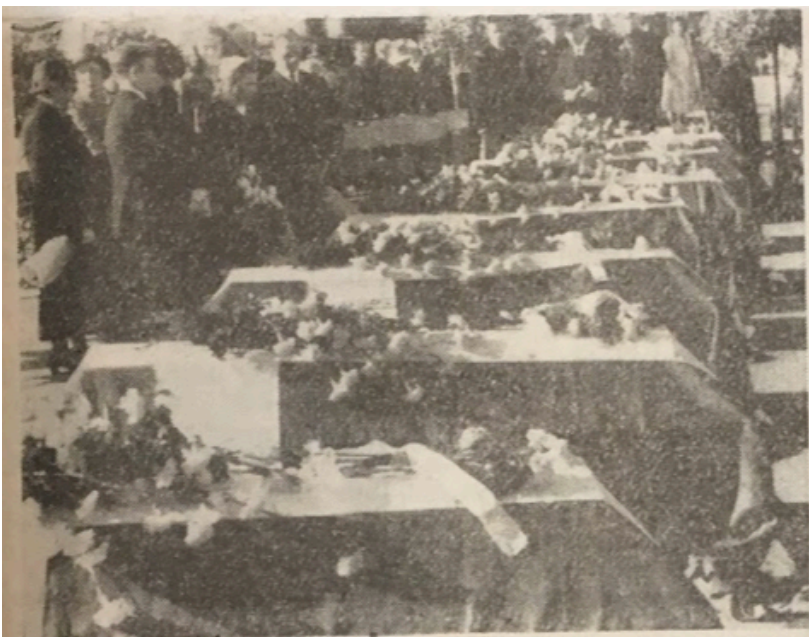
De syv Kister.