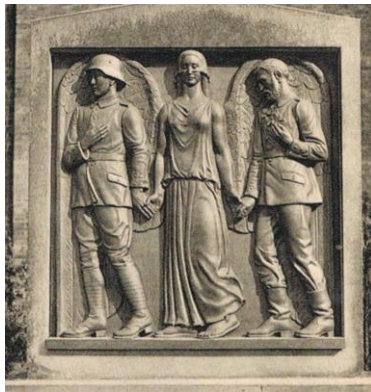
Mindesmærke fra Sct. Nicolai Kirke, Aabenraa

Foredraget fortæller med eksempler fra hele Sønderjylland og Sydslesvig om mindesmærkerne og de dramatiske stridigheder, som de blev centrum i.