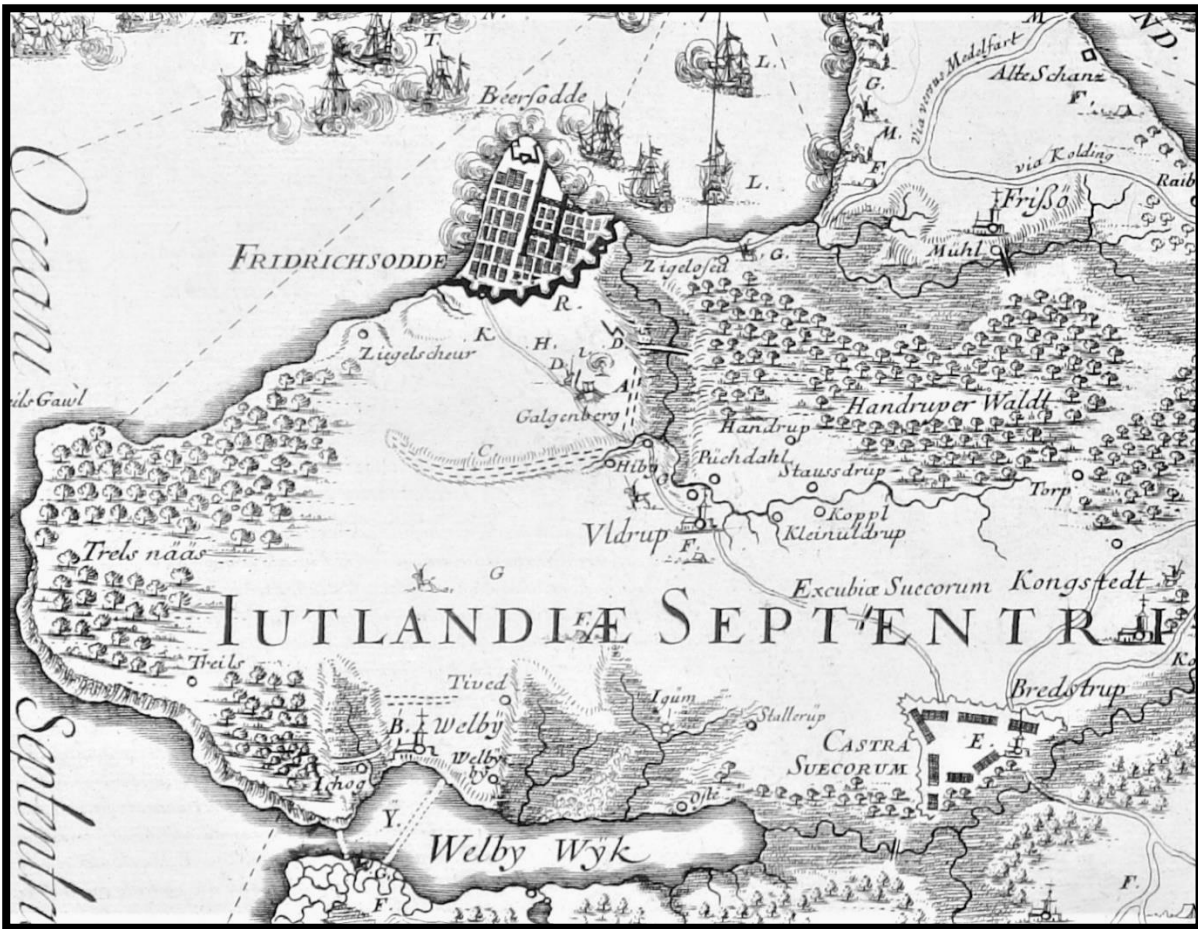
Svenskernes lejr nederst i billedet til højre. Tegning: Erik Dahlberg.

Soldaterne lavede en kæmpe lejr ved Bredstrup med byens kirke som centrum.