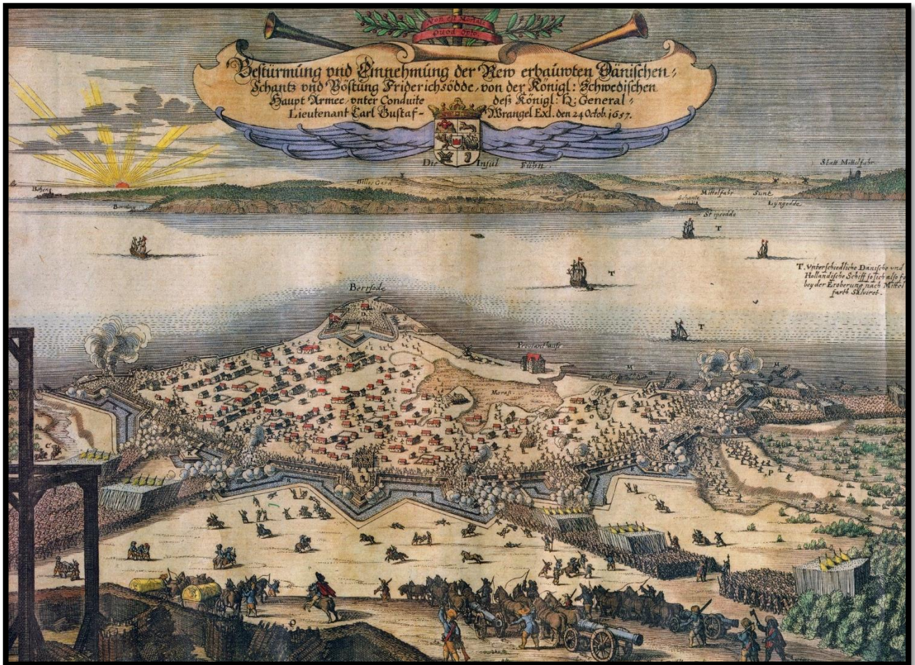
Svenskerne stormer Fredericia. Tegning: Erik Dahlberg.

Kl. 5 om morgenen den 24. oktober angreb svenskerne byen.