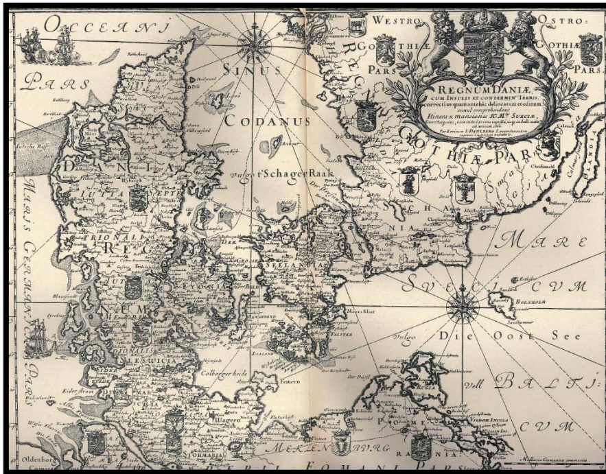
Danmark i 1600-tallet.

I 1600-tallet var Sverige Danmarks største fjende. De to lande ville begge have magten over Østersøen, og de gik derfor i krig i både 1563-70, 1611-13 og 1643-45. På grund af krigen var der flere gange mange fjender i hele Jylland.