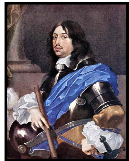
Karl Gustav den 10.

Den 24. august nåede svenskerne frem til Frederiksodde. De troede, at de hurtigt kunne tage fæstningen, men de blev overrasket over de store volde.